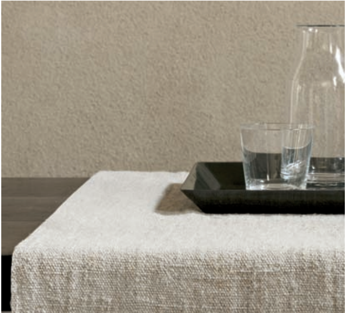
DC04 DGR Dark Green Vassoio in acciaio smaltato. Tray in enameled steel. Plateau en acier émaillé. Tablett aus Stahl, emailiert. cm 42 x 30 / 16 1 / 2 " x 11 3 / 4 "